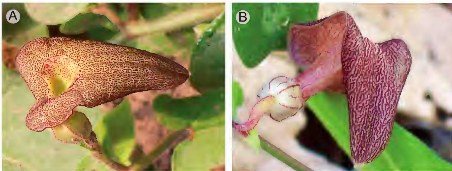
Fig. 2. Flor de Aristolochia rzedowskiana vista de frente (A) y de costado (B).

entero, obtuso o atenuado hacia el ápice, de 2.5-3.5 cm de largo, 1-1.5 cm de ancho, rojizo, papiloso-reticulado, excepto en la garganta, tubo doblado 80-90°, piloso en los nervios reticulados purpúreos, con una protuberancia en la parte basal junto al utrículo, de color verde a purpúreo, de (1.0)1-1.5(2) cm de largo, 2.5-3.5 mm de diámetro, utrículo oblongo-elipsoide, de 5-8 mm de largo, 4-6 mm de diámetro, siringe excéntrica, tubular, de 2-3.3 mm de largo, 1.5-1.8 mm de diámetro; ginos-temo 5-lobado, subestipitado, de 1.5-2.5 mm largo, 1.5-2 mm de diámetro, estípite de 0.6-1 mm de largo, 0.5-1 mm de diámetro, estambres 5, tetraloculares, anteras de 1-1.4 mm de largo, 0.4-0.6 mm de ancho; ovario piloso, de 5-7(8) mm de largo, 1.5-2 mm de diámetro; fruto capsular, subgloboso, septífraga marginal basípeta, de 1.8-2.5 cm de largo, 1.8-2.0 cm de diámetro; semillas numerosas (40-50 por fruto), triangulares, de color café, de 4-5 mm de largo, 4-6 mm de ancho, 1 mm de grueso, la superficie ligeramente tuberculada.